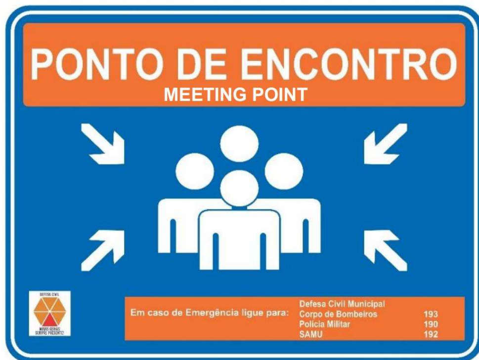
Figura 2 – Modelo de Placa de Ponto de Encontro.

As placas de ponto de encontro devem ser metálicas de 100 cm de comprimento x 75 cm de altura. Devido ao seu tamanho, as placas de ponto de encontro devem ser suportadas por dois postes de aço galvanizado.