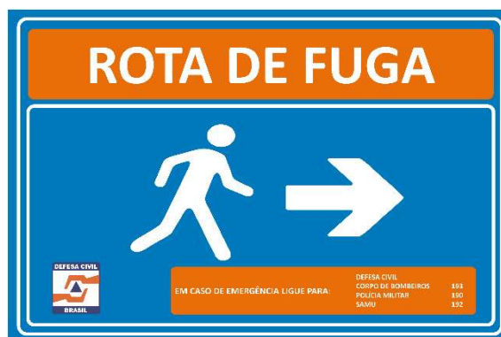
Figura 4 - Modelo de Placa de Rota de Fuga (Seta para a Direita).

O projeto inicial previa a instalação de placas de rota de fuga a cada 50 metros e sempre que houvesse mudança de direção, conforme orientação estabelecida na IT 001/2021.